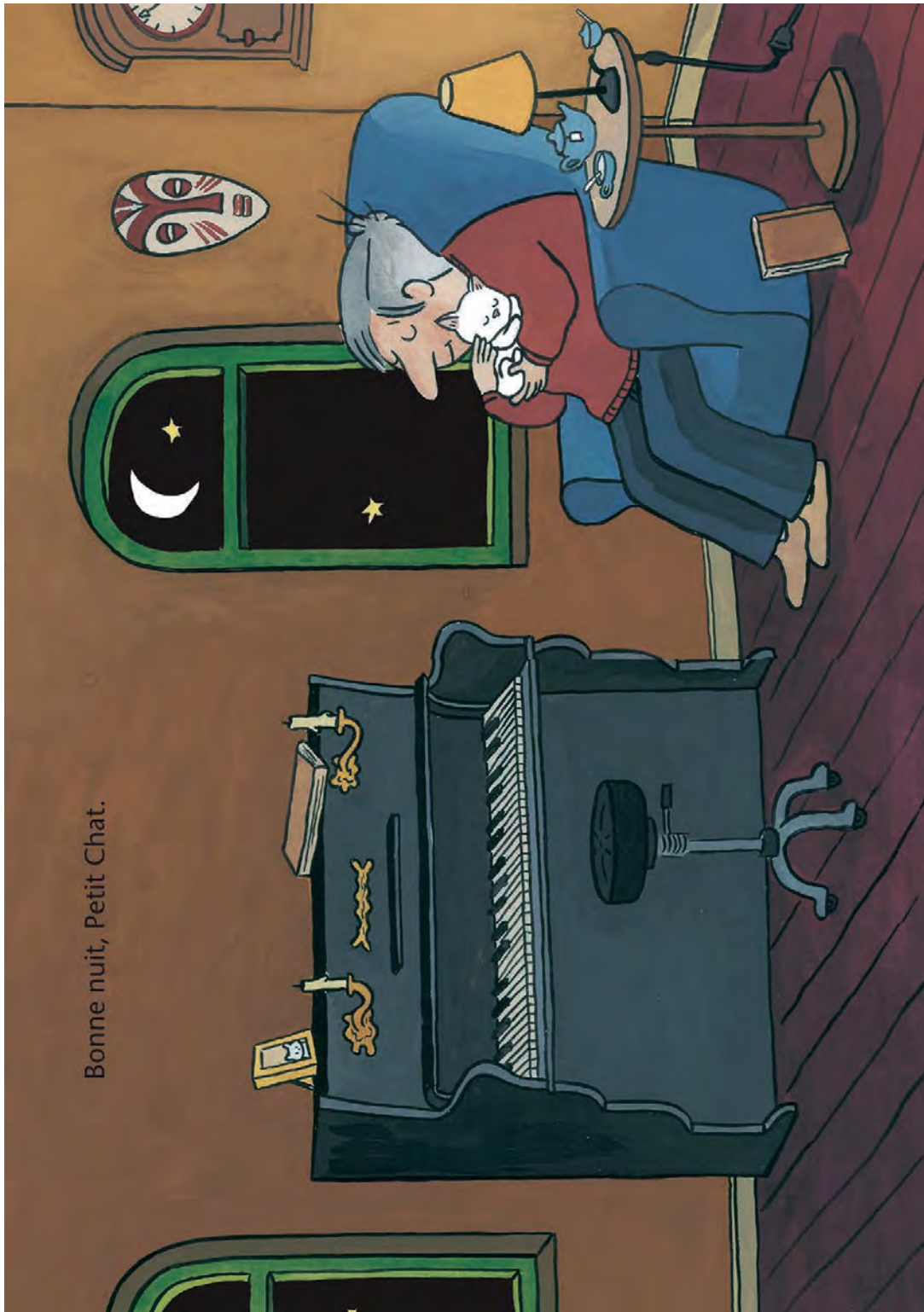
Bonne nuit, Petit Chat.