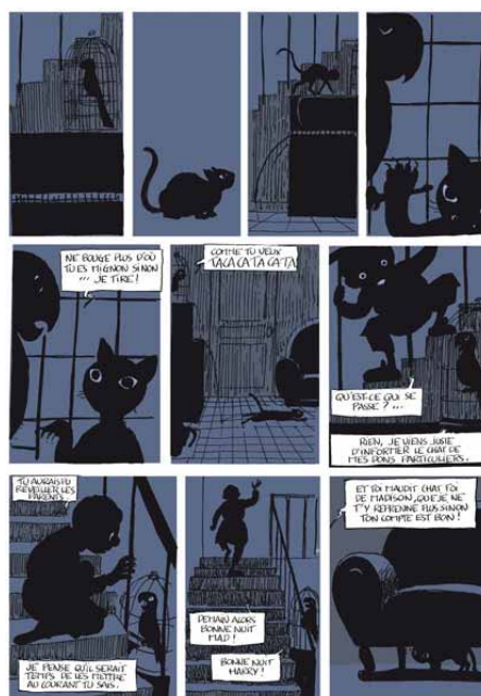
Harry est fou Rabaté © Mille bulles 2011 pages 3 et 15