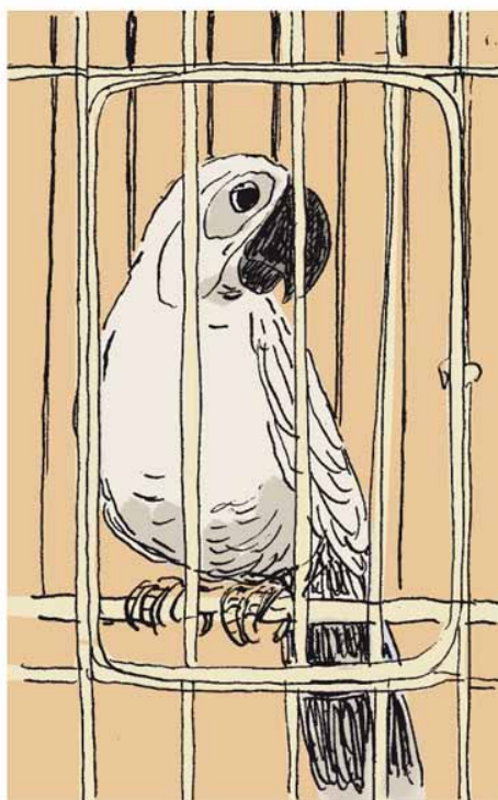
Harry est fou Rabaté © Mille bulles 2011 case1 page 8

C'est aussi l'occasion de faire entendre la voix d'un perroquet bavard [ http://www.youtube.com/watch?v=6Z30REqrtcs&feature=related ] et d'un perroquet amoureux de la musique, qui siffle merveilleusement [ http://www.youtube.com/watch?v=-W3zXWGHn04&feature=related ].