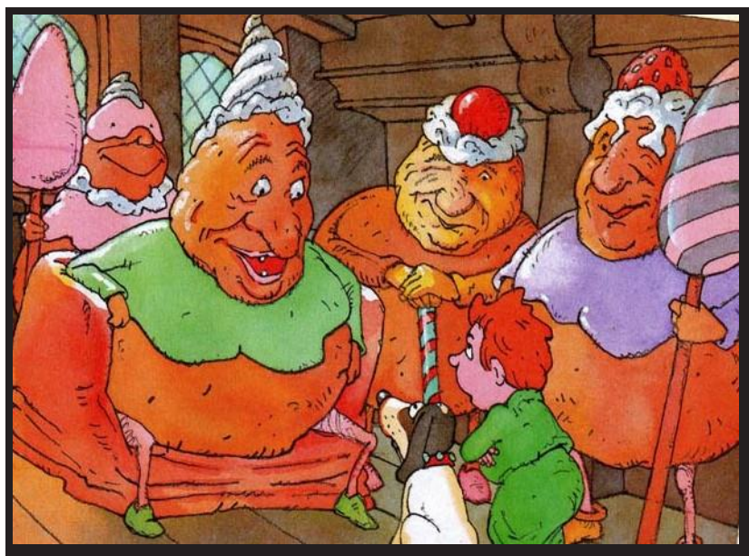
Les deux goinfres, Philippe Corentin