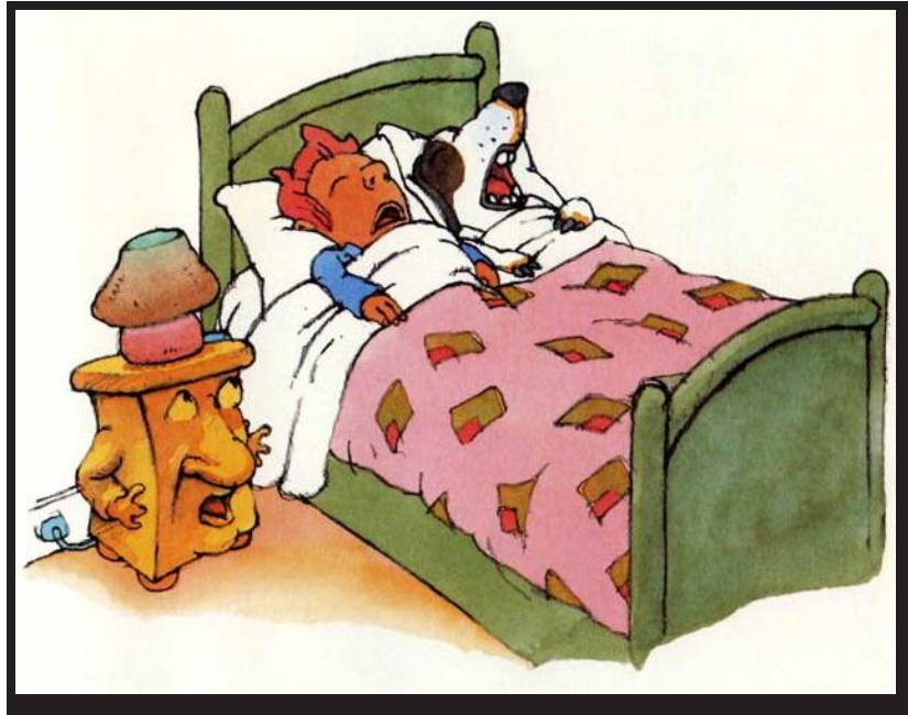
L'arbre en bois, Philippe Corentin