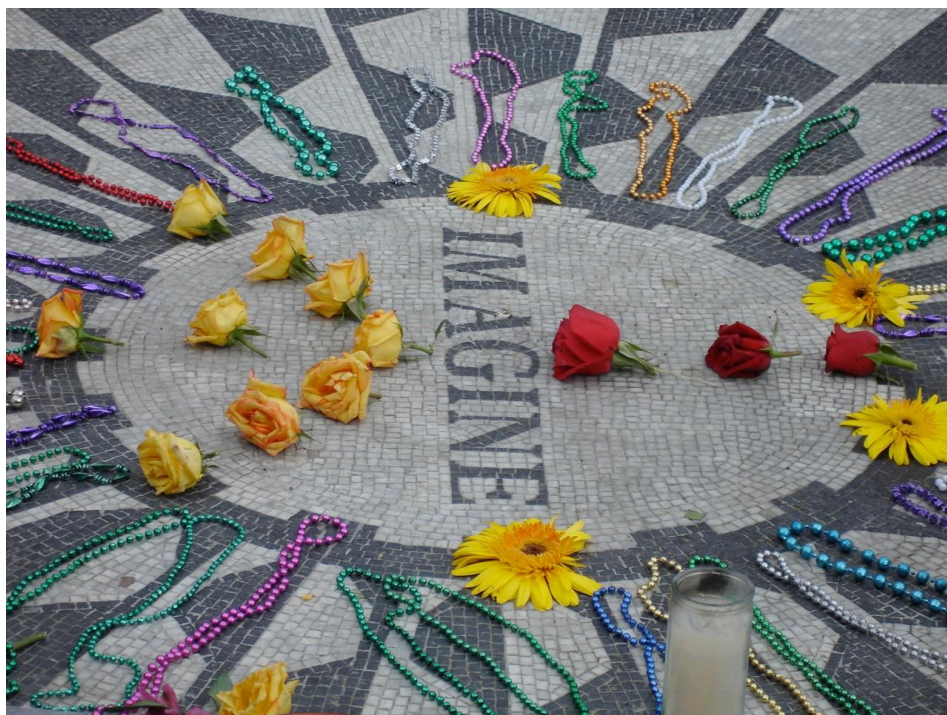
Central Park, l'endroit où John Lennon a été assassiné

Vous voulez la réécouter ? Et lire sa traduction ?